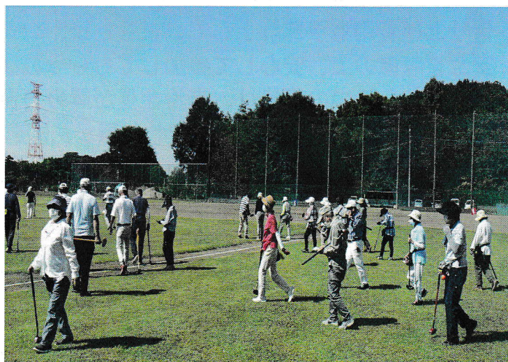
福田地区のグラウンドゴルフ大会“さあ、やるぞ！”