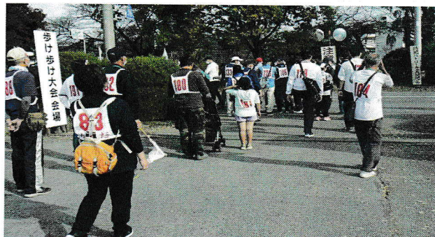
大人も子どもも和やかに“歩け歩け”

自治会、地区自治会連合会、野田市の各行事や活動がコロナで中止、縮小。そんな中、西三ヶ尾自治会の見守り隊は毎日朝夕学童のお世話を、白鷺梅郷住宅自治会のウォーキングパトロールは独自に毎週防犯活動を行っている。