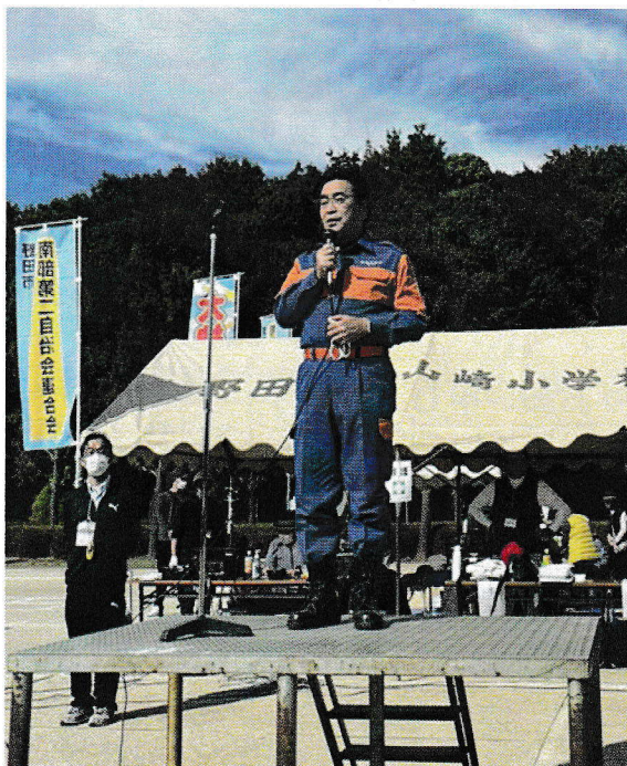
市の防災訓練終了後、南部第2地区の オータムフェスタにかけつけた鈴木市長